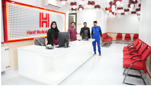
حذیف میڈیکل ہسپتال پونٹ