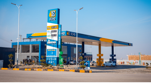
ایکو پٹرول پمپ

فیصل ہلز (FH) میں تمام ترقیاتی کام مکمل، اب وقت ہے اپنا گھر بنانے کا!